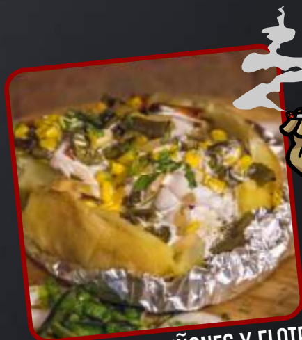
RAJAS, CHAMPIÑONES Y ELOTE