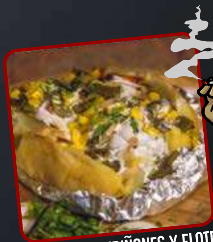
RAJAS, CHAMPIÑONES Y ELOTE